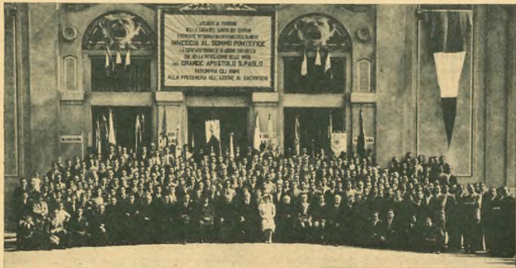
Torino - S. Paolo. - Il Rettor Maggiore tra i giovani ed i benefattori della cappella dedicata al Santo.