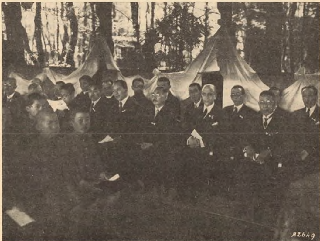
Giappone - Tokio. - Le Autorità intervenute alla testa col nostro Ambasciatore.

Numerosi anche gli oratoriani dell'incipiente Oratorio Festivo. Il programma stabilito fu svolto con fede e con amore, e riuscì di piena soddisfazione a tutti. Il poderoso coro dei nostri chierici specialmente nella Messa Cantiam di Don Bosco a tre voci, scritta per l'occasione, nella solenne antifona Corona aurea , nell'operetta Marco il pescatore tradotta in giapponese, si affermò tra la meraviglia e il compiacimento universale. Il Primo Reparto Esploratori Cattolici di Tokio