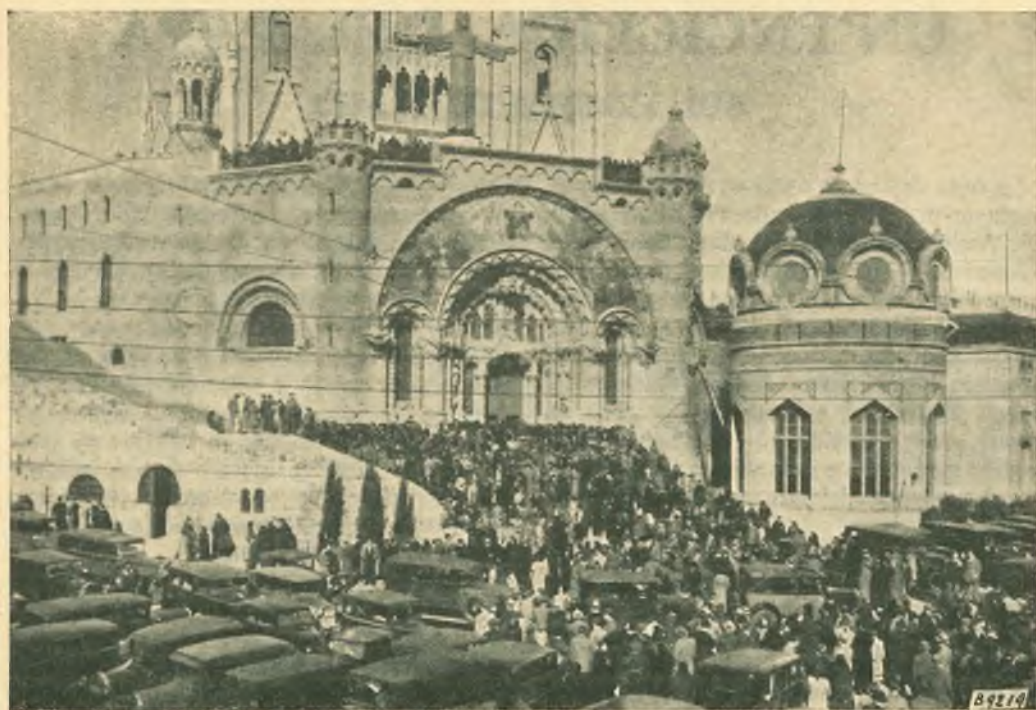
Barcelona. Il tempio votivo del "Tibidabo" devastato e profanato nel luglio u. s.

In alto la grande statua del Sacro Cuore, in bronzo, alta 8 m., del peso di 12 tonnellate, abbattuta e deturpata.