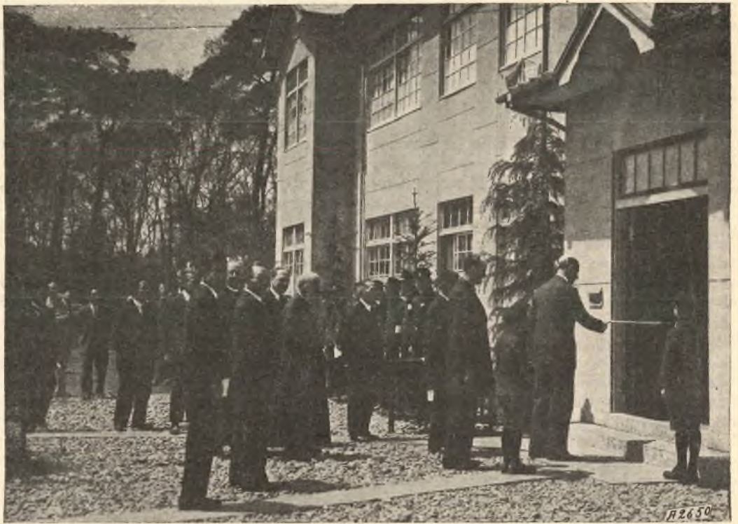
Giappone - Tokyo. - S. E. l'Ambasciatore d'Italia, Giacinto Auriti, inaugura l'Esposizione Salesiana del Libro.

La mite figura del Papa missionario domina benedicente i suoi figli, che lo inghirlandano con un festone ornamentale, formato dalle migliori svariate loro produzioni.