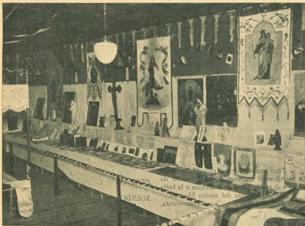
Giappone - Nakatsu. - Una sezione della "Mostra religiosa".