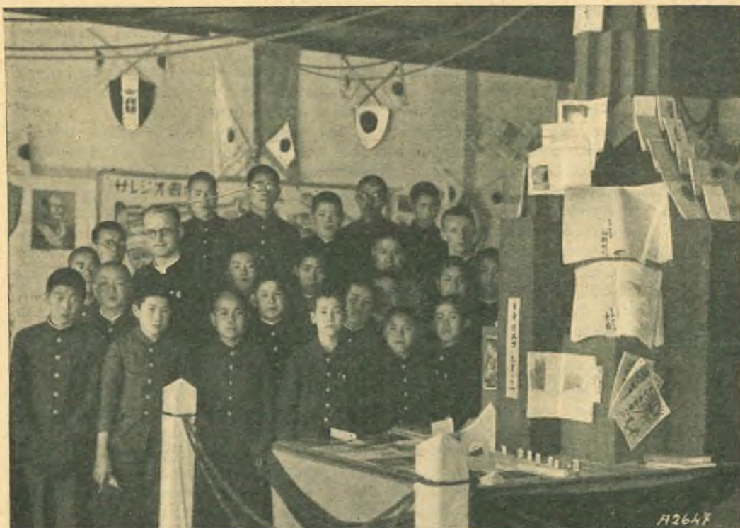
Giappone - Tokyo. - La 1ª Esposizione Salesiana del Libro.